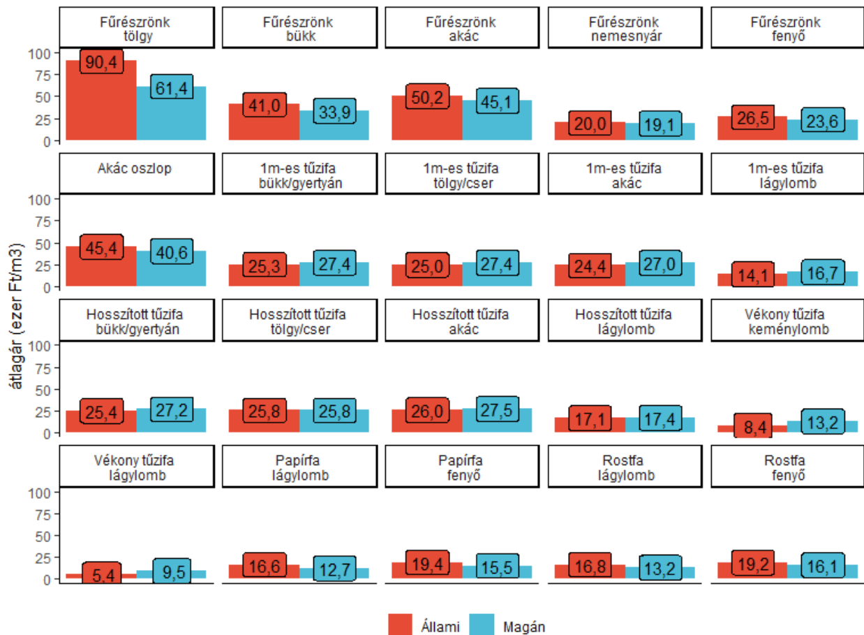
1. ábra Egyes erdei fatermékek árstatisztikái az állami és a magánszektorban. Az árak ÁFA nélkül értendők, vágástéri vagy felsőrakodói értékesítésre vonatkoznak. A fűrészrönk álgesztmentes 2,5 m/30 cm méretű. Az 1 m-es tűzifa jellemzően 30 cm alatti átmérőjű. A hosszított tűzifa legalább 2 m hosszú, jellemzően 30 cm alatti csúcsátmérőjű. A vékony tűzifa 5 cm alatti átmérőjű.