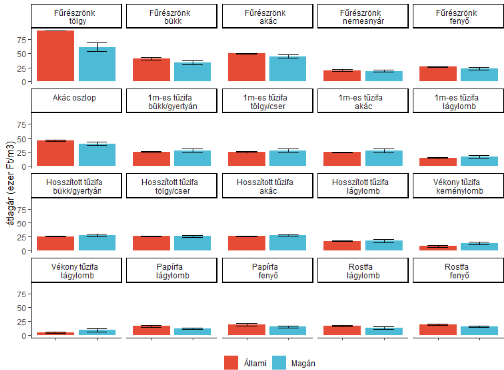
3. ábra Egyes erdei fatermékek árstatisztikáira számított konfidencia intervallumok az állami és a magánszektorban.